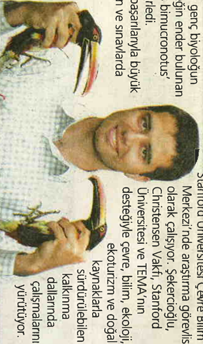
Genç biyolog, her türlü doğa sporunu yapıyor.

Zekası ve başarılarıyla büyük takdir toplayan ve sınavlarda aldığı iyi dereceler sayesinde tam burs ile Harvard Üniversitesi'ne kabul edilen