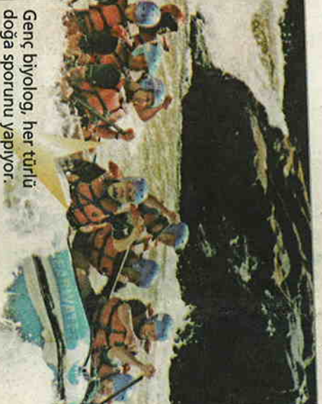
Genç biyolog, her türlü doğa sporunu yapıyor.